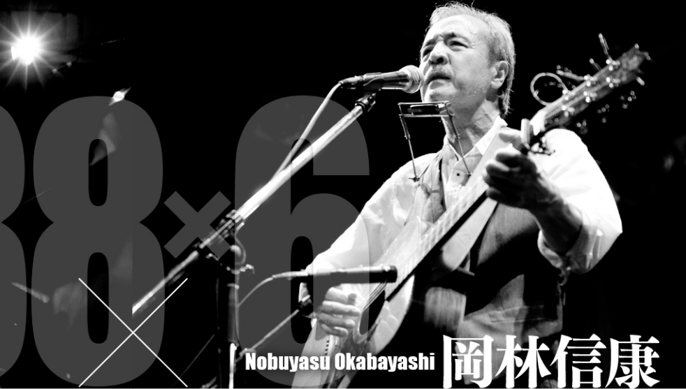
Nobuyasu Okabayashi 岡林信康

Profile ◎1969年、山下洋輔トリオを結成、フリー・フォームのエネルギッシュな演奏でジャズ界に大きな衝撃を与える。国内外の一流ジャズ・アーティストとはもとより、和太鼓やシンフォニー・オーケストラとの共演など活動の幅を広げる。88年、山下洋輔ニューヨーク・トリオを結成。国内のみならず世界各国で演奏活動を展開する。