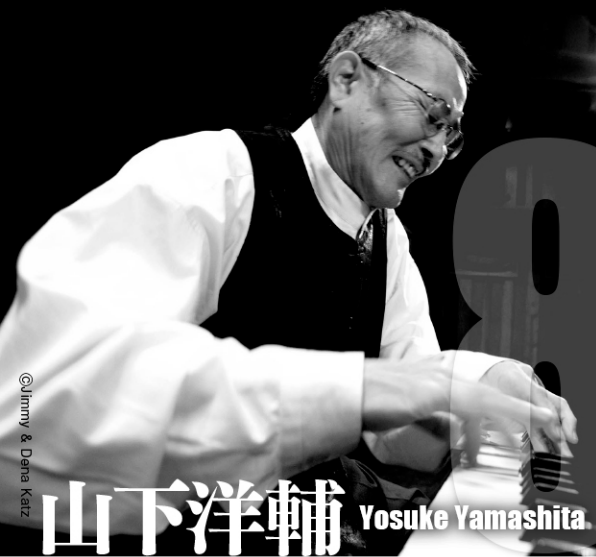
山下洋輔 Yosuke Yamashita